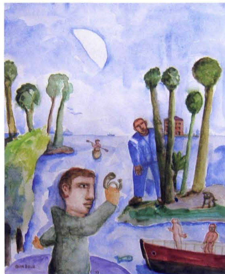
Gorki Bollar, Mirage, aquarel, 25 x 20 cm, 2010

Ik waag hier overigens wat dat betreft de bewering dat Friedrich Nietzsche - die zich aan het eind van zijn leven rechtstreeks tot het opperwezen wendde en zélf ook beslist goddelijke aspiraties had - met zijn beroemde uitspraak niet zozeer bedoelde dat de oergrond van al het Zijn, de schepper van hemel en aarde, naar wiens beeltenis de mens is geschapen, dood en begraven is, maar dat met het aanbreken van de moderne tijd - nu de mens misschien nog niet volwassen geworden is maar toch tenminste de adolescentie bereikt heeft - hij het goddelijke in zichzelf moet vinden en ontwikkelen. De mens tenslotte, is óók nog niet af... In 'La Tentation de Saint Antoine', 'De Verzoeking van de Heilige Antonius', heeft Gustave Flaubert van deze stand van zaken een prachtig en nog altijd relevant panorama geschilderd, waarin alle fabel-