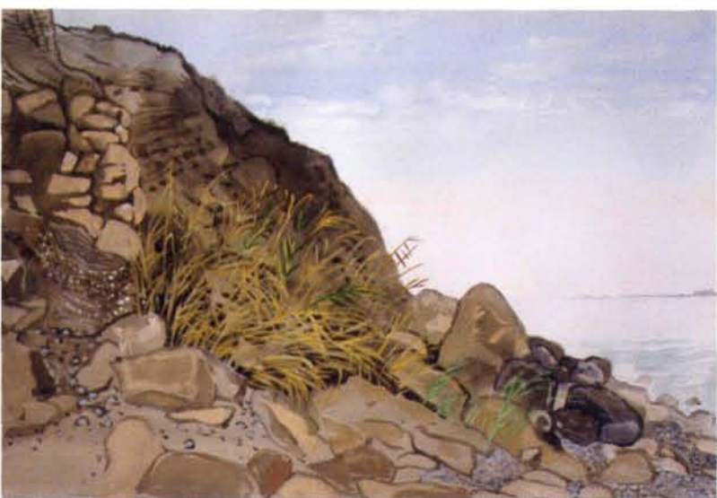
Theo de Feyter, Syrië - aan de oever van het stuwmeer