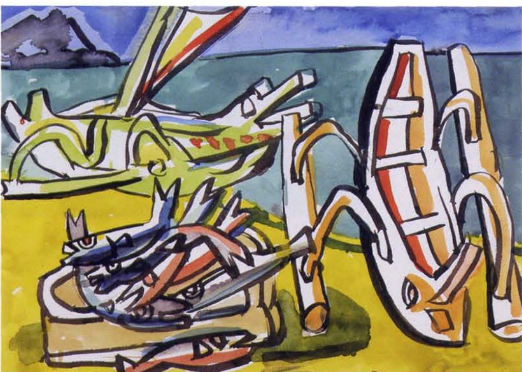
Paul Husner, Vangst van de dag, Aquarel 21 x 30 cm