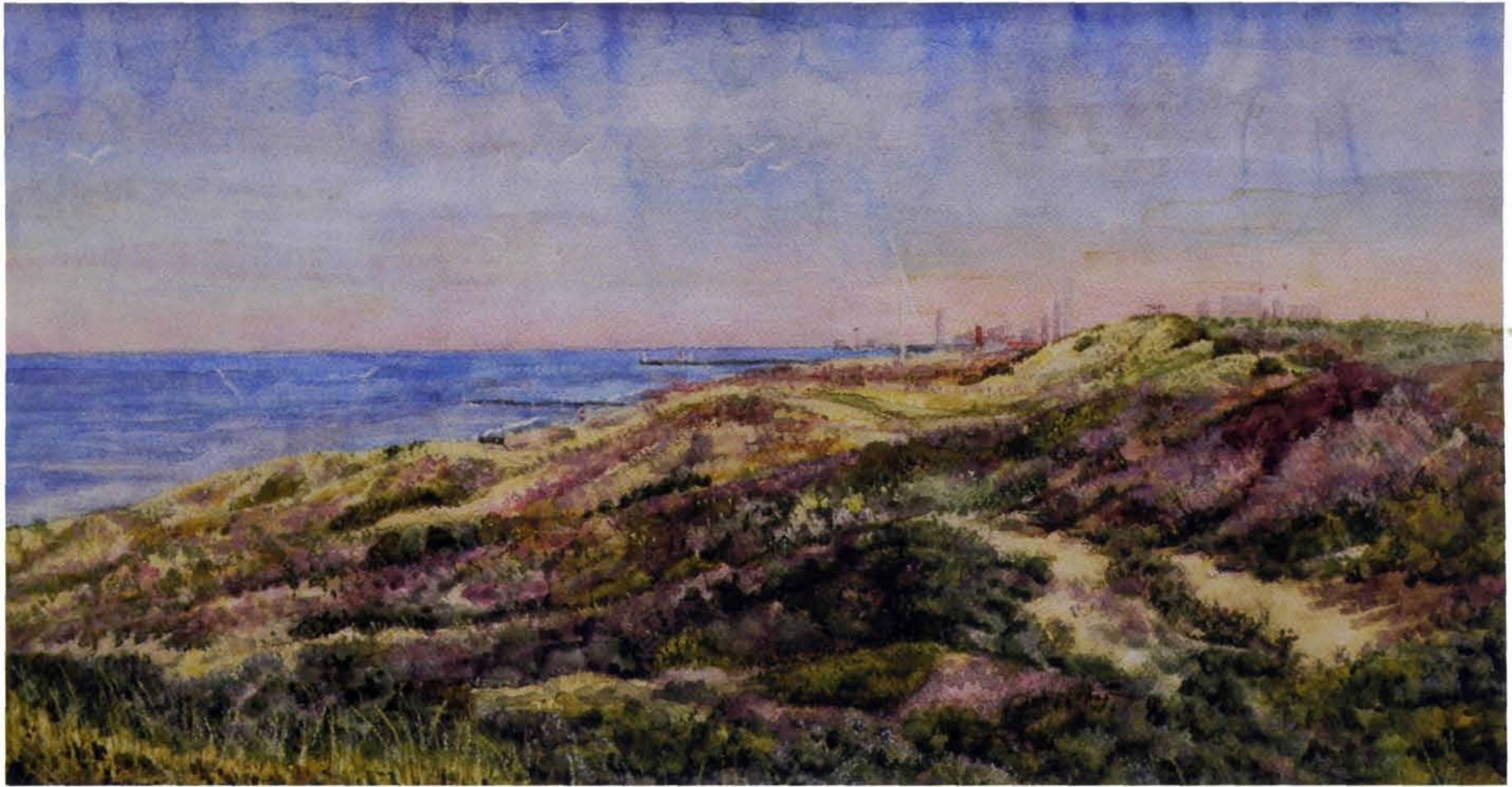
Kris Spinhoven, Vanaf uitkijkgduin De Savornin Lohmanlaan, Den Haag, 26 x 50 cm

dieren, toverwezens, mythologische personages, halfgoden, goden en oppergoden het moeten afleggen tegen de Dood en de Duivel. Alleen Christus blijft overeind als zoon van de Levende.