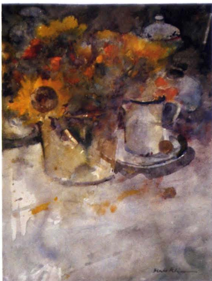
Max Kleinen, Zonnebloemen, 50 x 66 cm

Van die controverses en tegenstellingen, die vijandelijkheden en conflicten is in het postpostmoderne tijdperk niet veel meer over. In de Hollandse