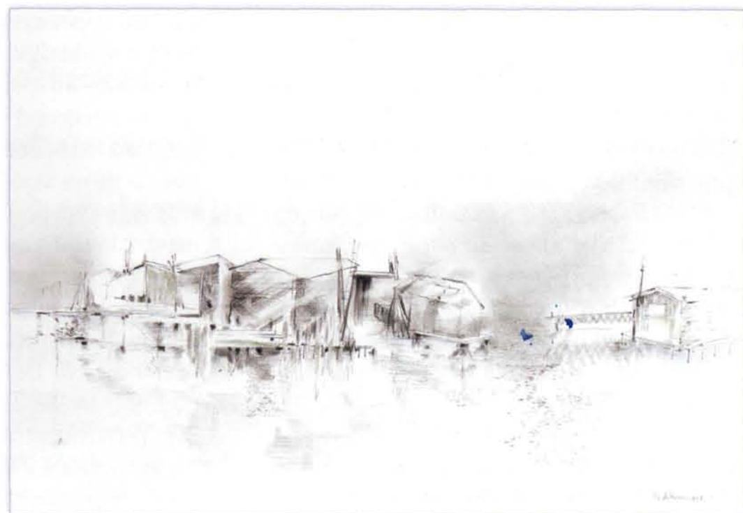
Ton de Kroon. Overbrugging. 48 x 70 cm. 2008