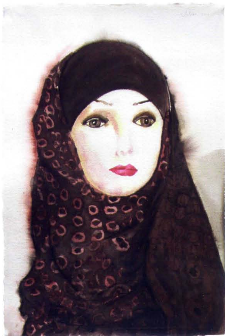
Rudolf Valster, Halal Madonna, aquarel, 56 x 38 cm, 2010

Voor kunstenaars, en voor wetenschappers geldt dit ook, is de schepping nog niet af. Met een voor 'gewone' mensen soms onbegrijpelijke ijver en vasthoudendheid, met nauwgezetheid en geduld en soms wanhopig onderzoeken zij nieuwe gezichtspunten, andere verbanden, onontdekte betekenissen.