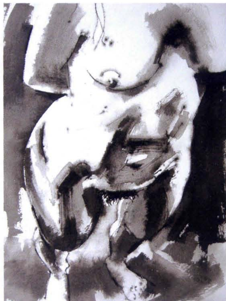
Michiel Schepers, naakt, aquarel, 30 x 20 cm