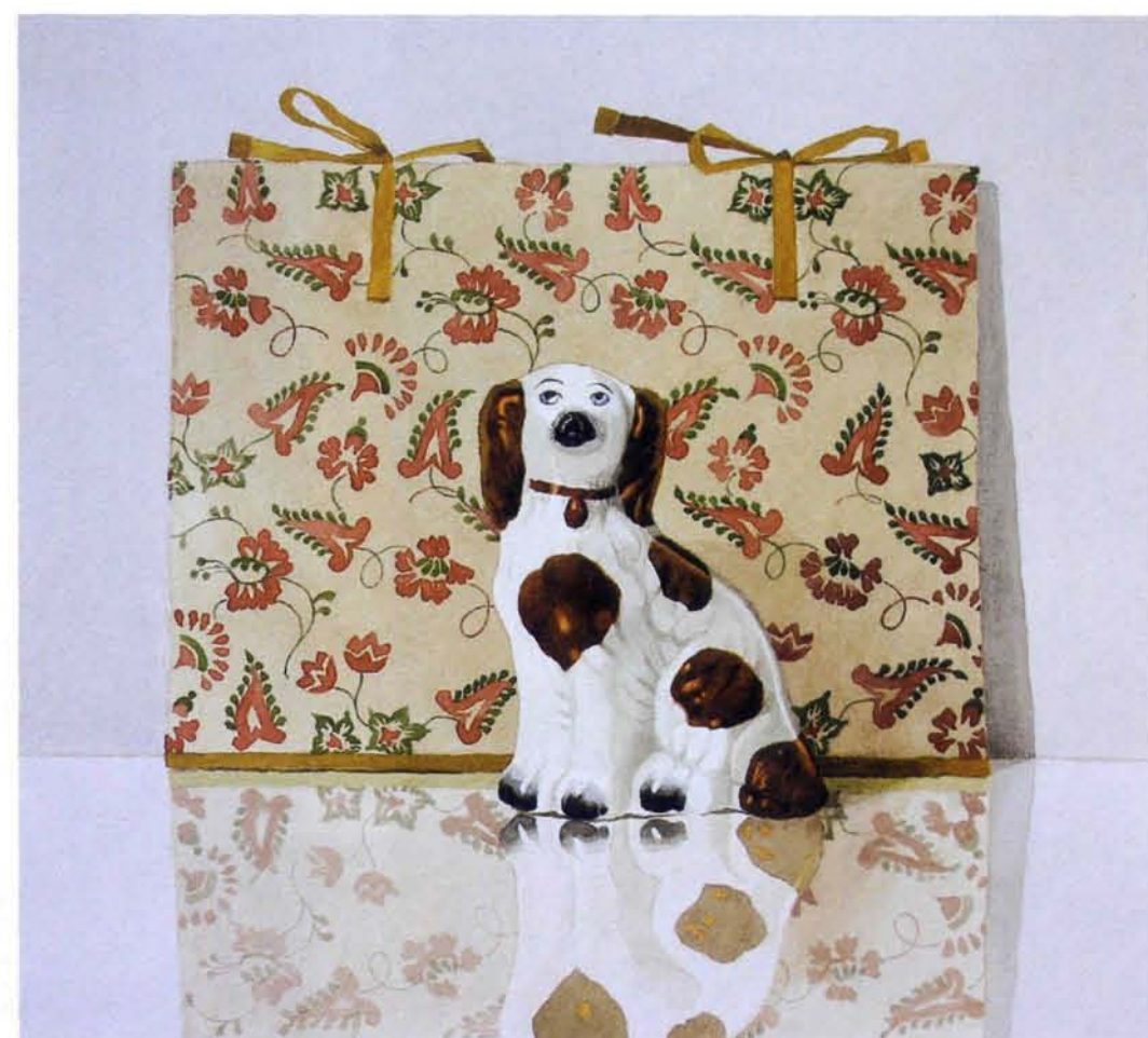
Agnes van Gelder, Hondje voor portefeuille, 29 x 32 cm