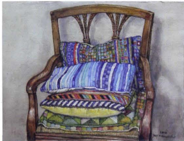
Jaap Nieuwenhuis, Stoel met kussen