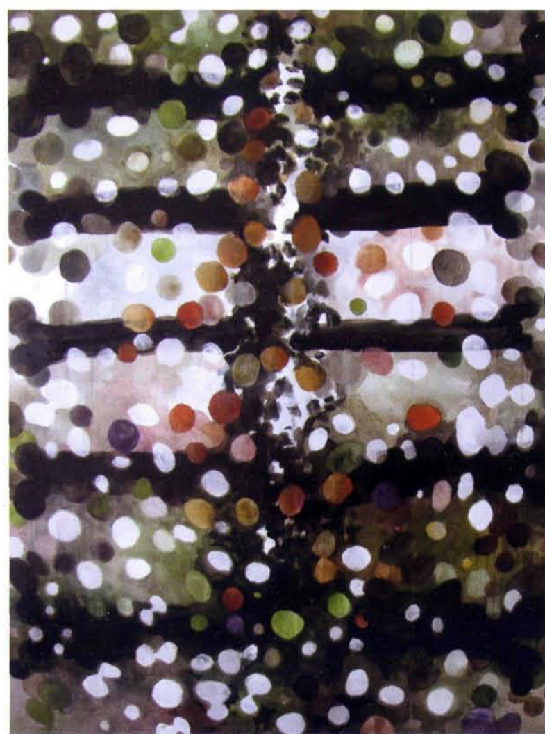
Marjoke Staal, Uitbotten 2, aquarel op doek, 80 x 120, 2008