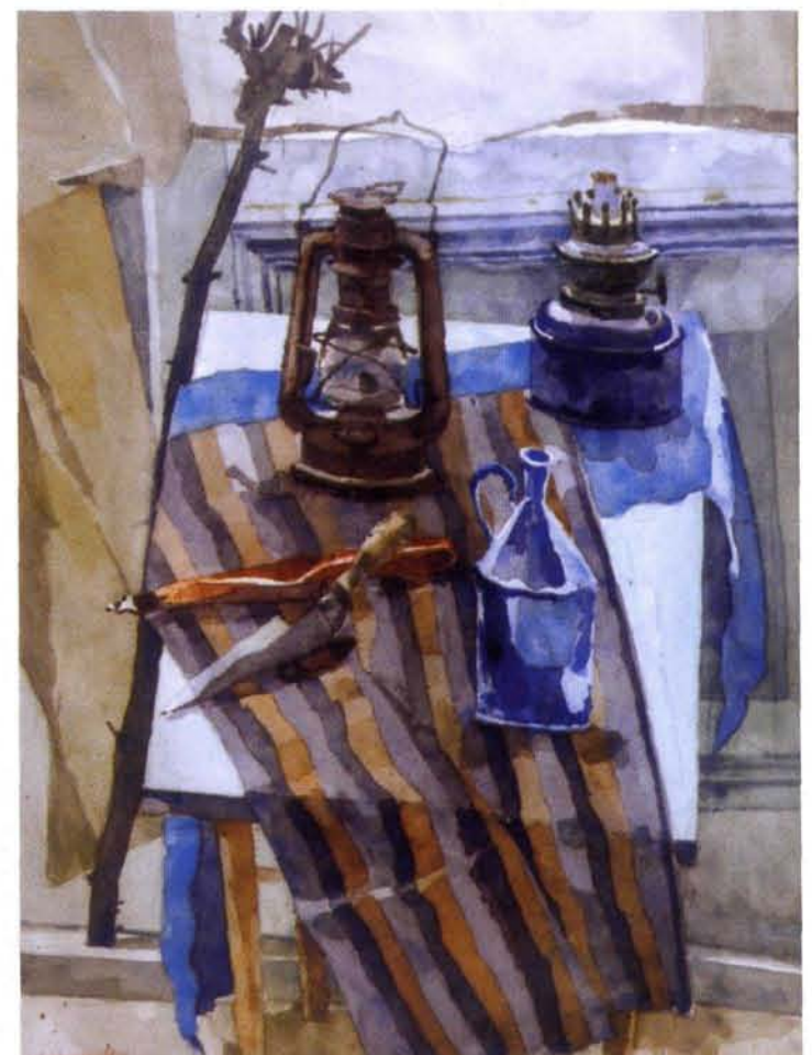
Jan van Spronsen, Stilleven op blauwe en gestreepte lap, aquarel, 71,5 x 52,5 cm