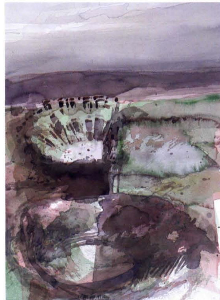
Jaap Ploos van Amstel. Theater en Amphitheater, aquarel, 50 x 40 cm, 1990